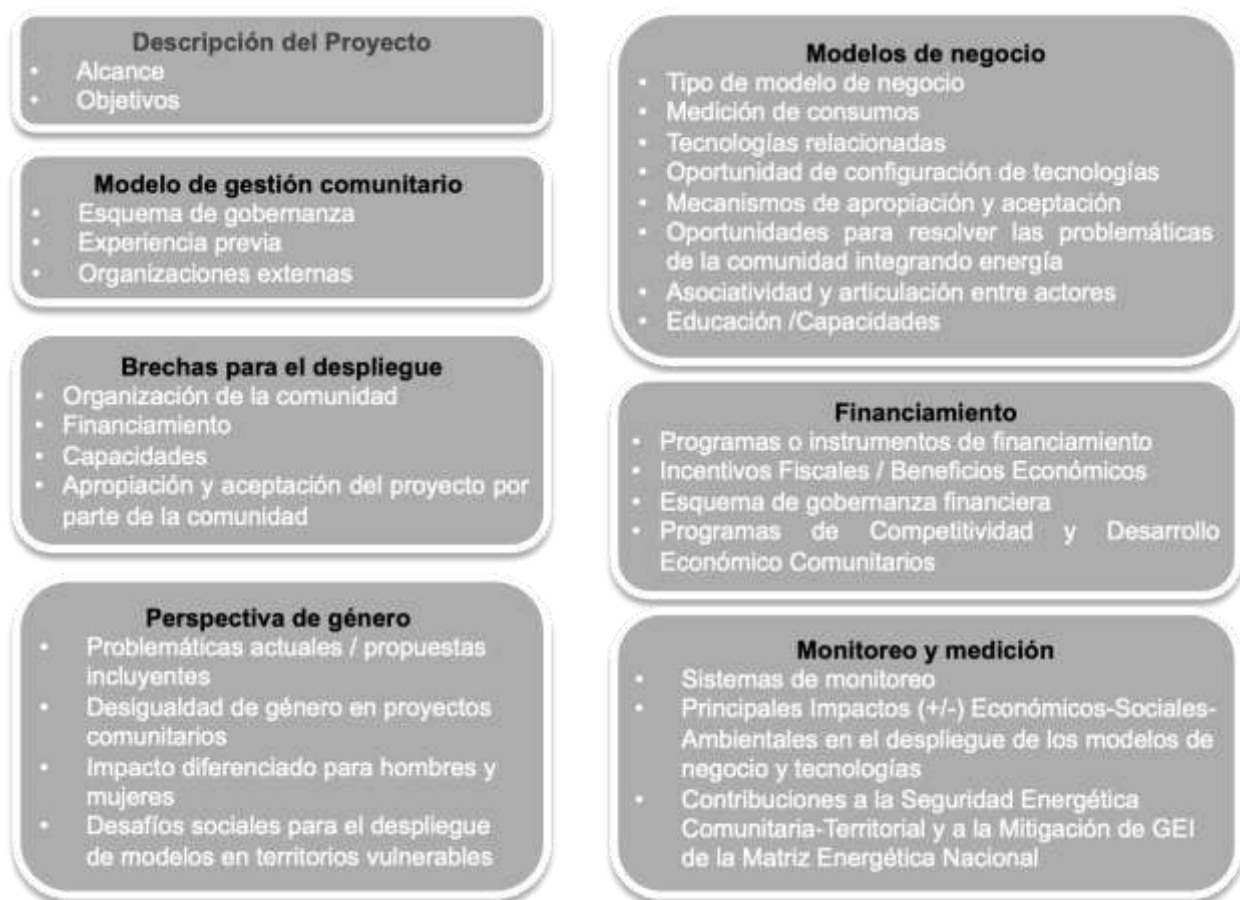
Ilustración 2. Criterios para la evaluación de proyectos

Para la identificación de buenas prácticas que pueden brindar apoyo para la implementación de nuevos proyectos se realizó un análisis (ver Ilustración 8) a partir de la información de cinco proyectos piloto (Tlaquepaque, Cuetzalan, Punta Allen, Parres y Topilejo) y dos acompañamientos técnicos (Coatepec y San Lorenzo Cacaotepec) se obtuvieron las siguientes conclusiones que facilitarán la implementación de nuevos proyectos.