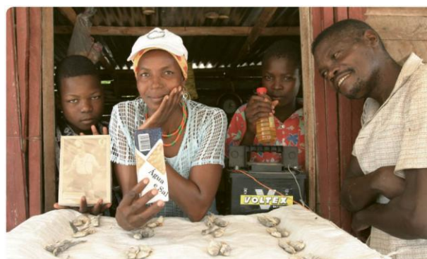
Les petits commerces peuvent prolonger leurs heures de travail dans la soirée.

→ le facteur à double énergie qui représente le fait que certains ménages et institutions sociales ayant accès bénéficiaient déjà de services énergétiques modernes à partir d'un autre service (et par définition, tout bénéficiaire ne sera compté qu'une seule fois: lors de sa première connexion à un service).