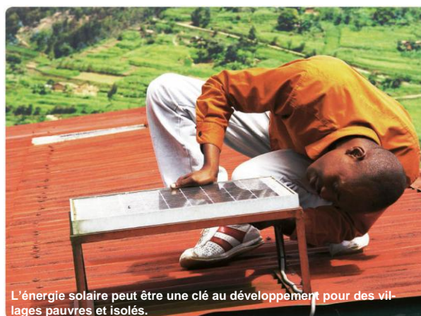
L'énergie solaire peut être une clé au développement pour des villages pauvres et isolés.

Les technologies et services principalement promus dans les programmes d'EnDev comprennent l'énergie photovoltaïque, la densification du réseau électrique, l'énergie micro-hydraulique, les foyers améliorés et le biogaz.