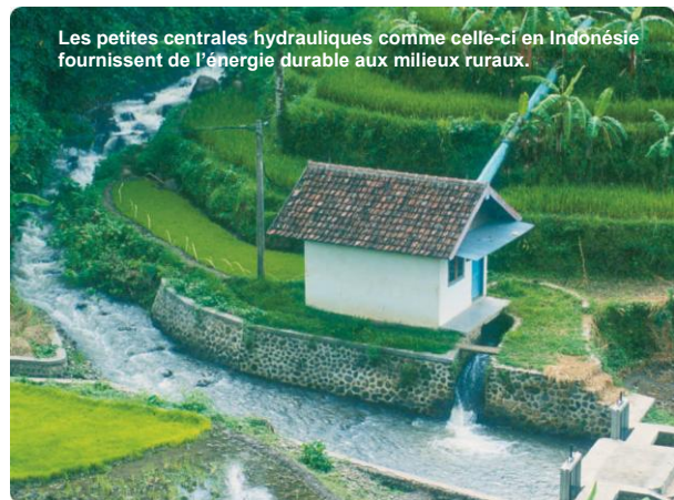
Les petites centrales hydrauliques comme celle-ci en Indonésie fournissent de l'énergie durable aux milieux ruraux.

L'objectif de la première phase a été dépassé. En juin 2011, approché 8 millions de personnes ont été approvisionnées soit en l'électricité soit en technologies améliorées de cuisson dans les ménages. En outre