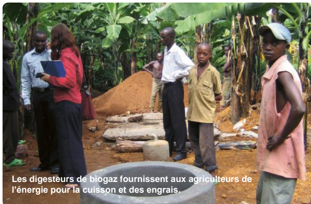
Les digesteurs de biogaz fournissent aux agriculteurs de l'énergie pour la cuisson et des engrais.

Les activités se focalisent clairement sur les services et ressources énergétiques, qui sont fiables, abordables, socialement acceptables et respectueuses de l'environnement. Les initiatives d'EnDev devraient compléter les activités en cours. Par conséquent, les critères de base pour les activités qui seront soutenues par EnDev concernent à la fois les résultats quantitatives et de la durabilité à long terme.