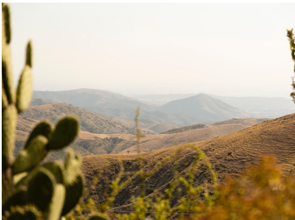
Foto: Sierra de Lobos, León, México.

Con el objetivo de valorar los servicios que la naturaleza brinda a las poblaciones que habitan en las ciudades mexicanas, el programa CiClim de la GIZ, apoya el desarrollo de la estructura conceptual y metodológica para poner en funcionamiento modelos de pago, por servicios ambientales en dos ciudades. Esta estructura fue realizada después de un proceso participativo multi-actor.