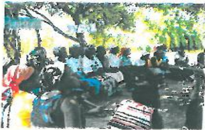
Grupo de poupança da Cerâmica