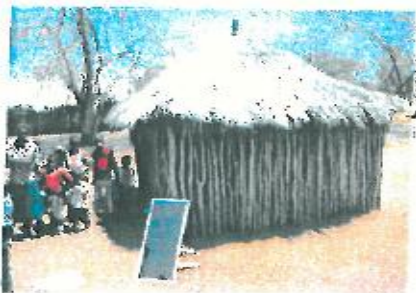
Promoção de sistemas foto voltaicos