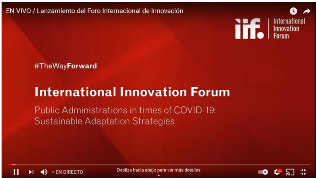
Evento de apertura del Foro Internacional de Innovación.