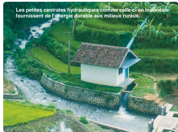
Les petites centrales hydrauliques comme celle-ci en Indonésie fournissent de l'énergie durable aux milieux ruraux.

L'objectif de la première phase a été dépassé. En juin 2011, approché 8 millions de personnes ont été approvisionnées soit en l'électricité soit en technologies améliorées de cuisson dans les ménages. En outre 30.000 d'infrastructures sociales et de petites