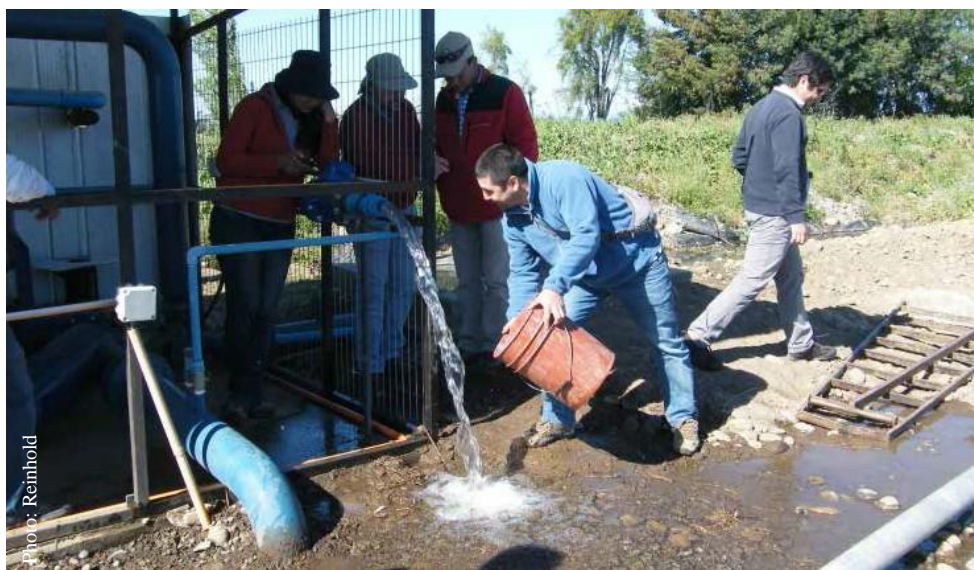
Medición del flujo de agua