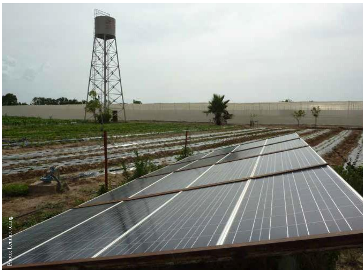
SPIS provisto de un reservorio elevado, utilizado para riego dentro y fuera del invernadero