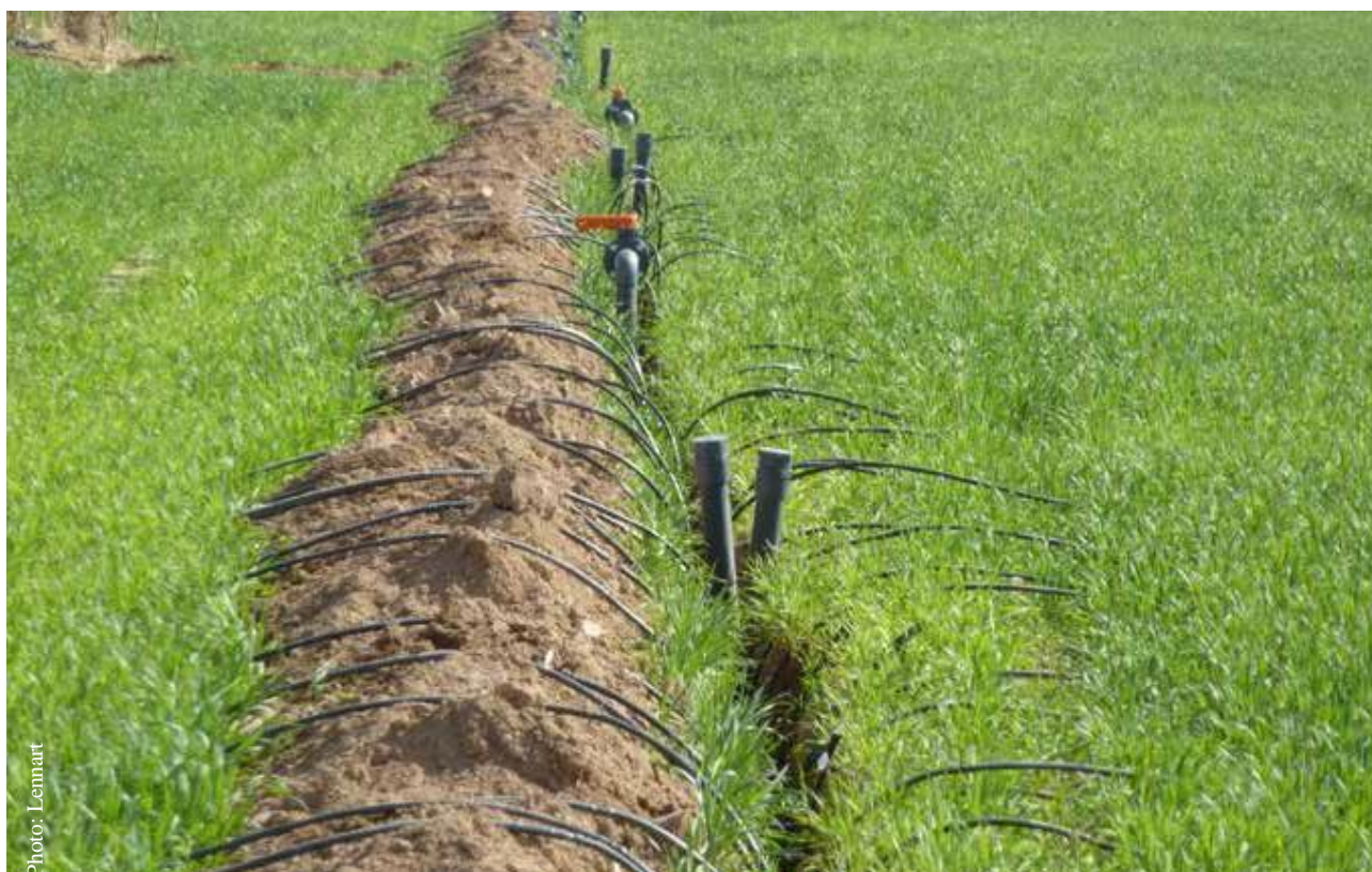
Instalación de un sistema de riego por goteo