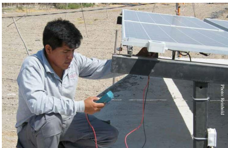
Midiendo la irradiancia solar durante la prueba de aceptación in situ