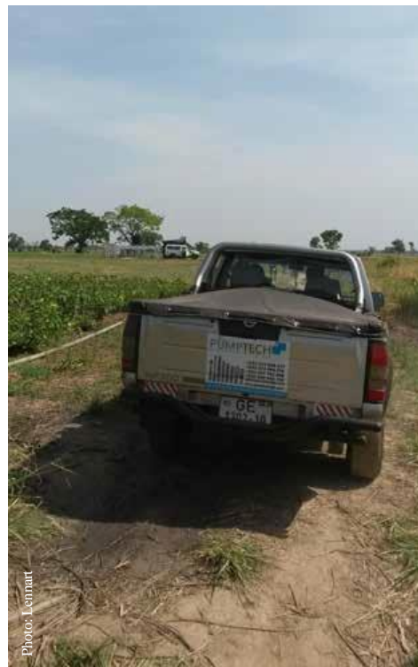
Un instalador visita el sitio de un SPIS en Tamalé, Ghana