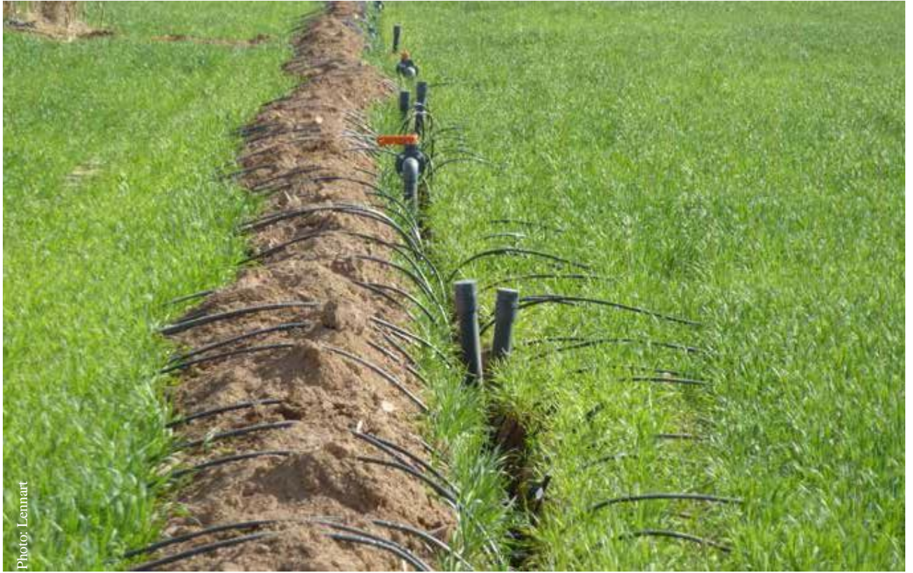
Instalación de un sistema de riego por goteo