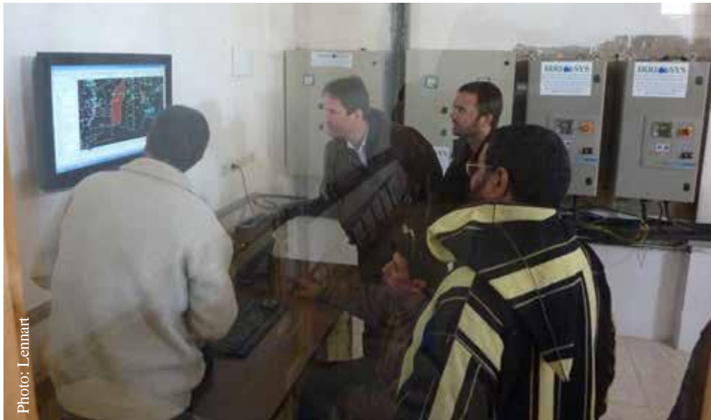
Sistema de riego automatizado en Marruecos – subsidiado en gran parte por el Estado