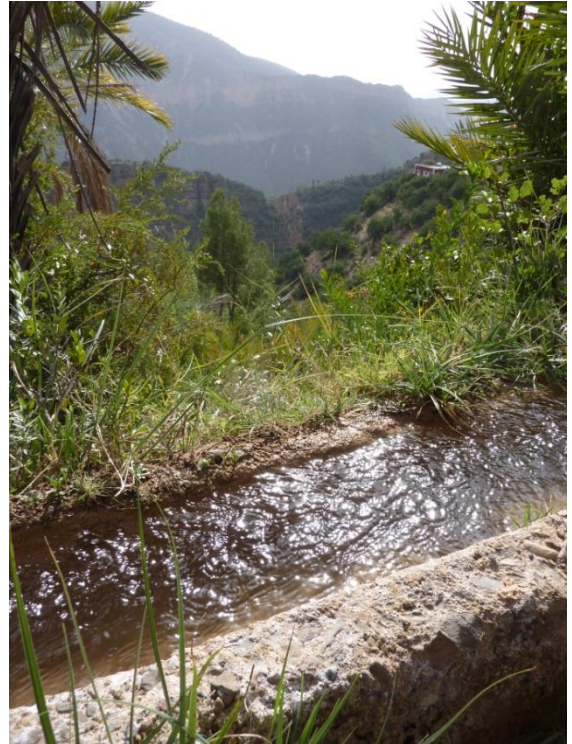
Canal de riego de hormigón

Las rutinas de mantenimiento influyen en la eficiencia operativa y el tiempo de vida del SPIS. El productor o productora puede establecer el plan de mantenimiento con la ayuda de un proveedor profesional de servicios. El presente módulo ofrece ejemplos de listas de verificación. Es importante que las actividades de mantenimiento se documenten y se vigilen con precisión.