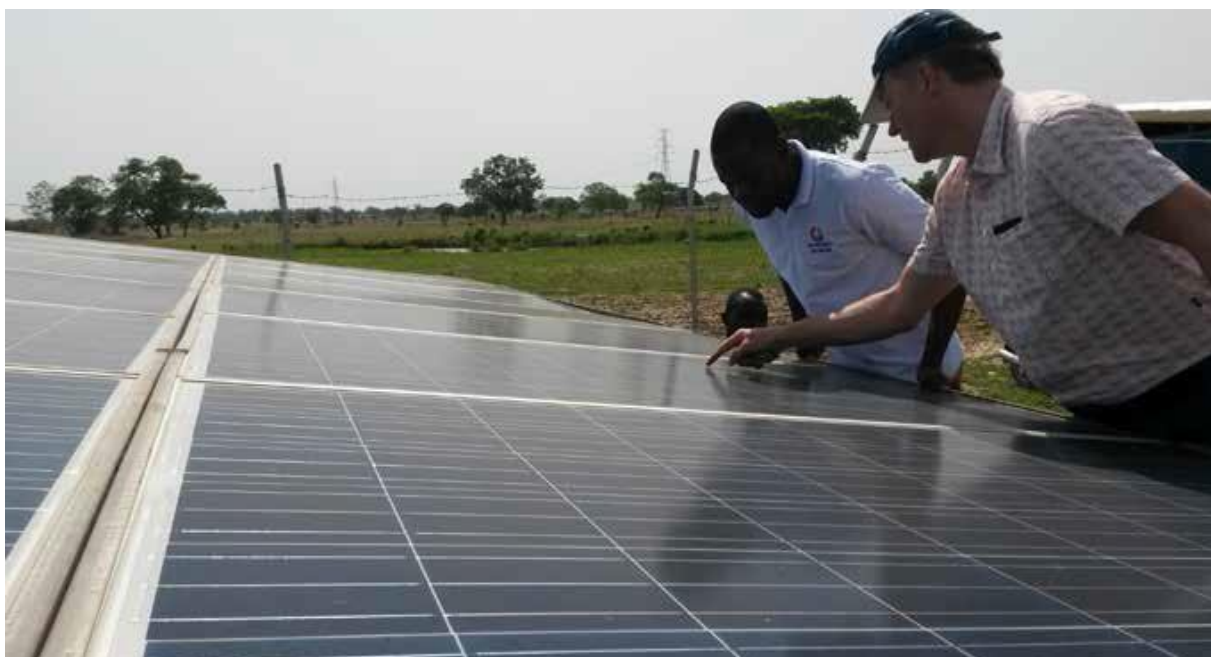
Inspección visual de los paneles solares

Nota: Los paneles calientes no se deben rociar con agua fría – ¡podrían rajarse!