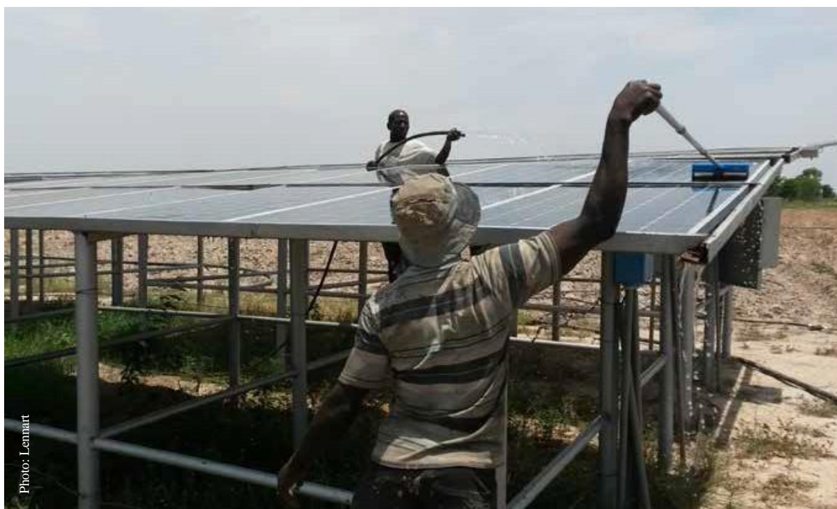
Limpeza de los paneles solares en Ghana como actividad de mantenimiento rutinaria