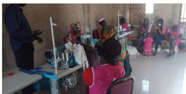
Elèves couturières en formation dans l'unité de la FEDER