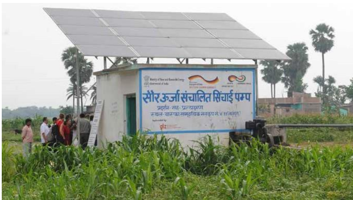
Visita de campo al sitio de un SPIS en la India