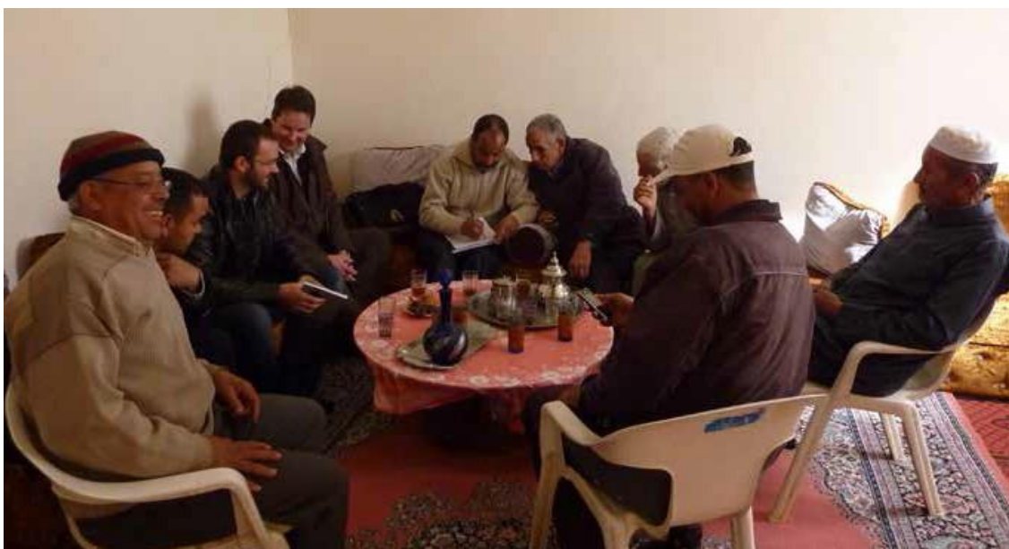
Reunión de un grupo de agricultores