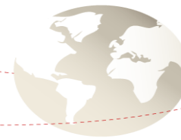
Table Ronde Energie Solaire à Gabès