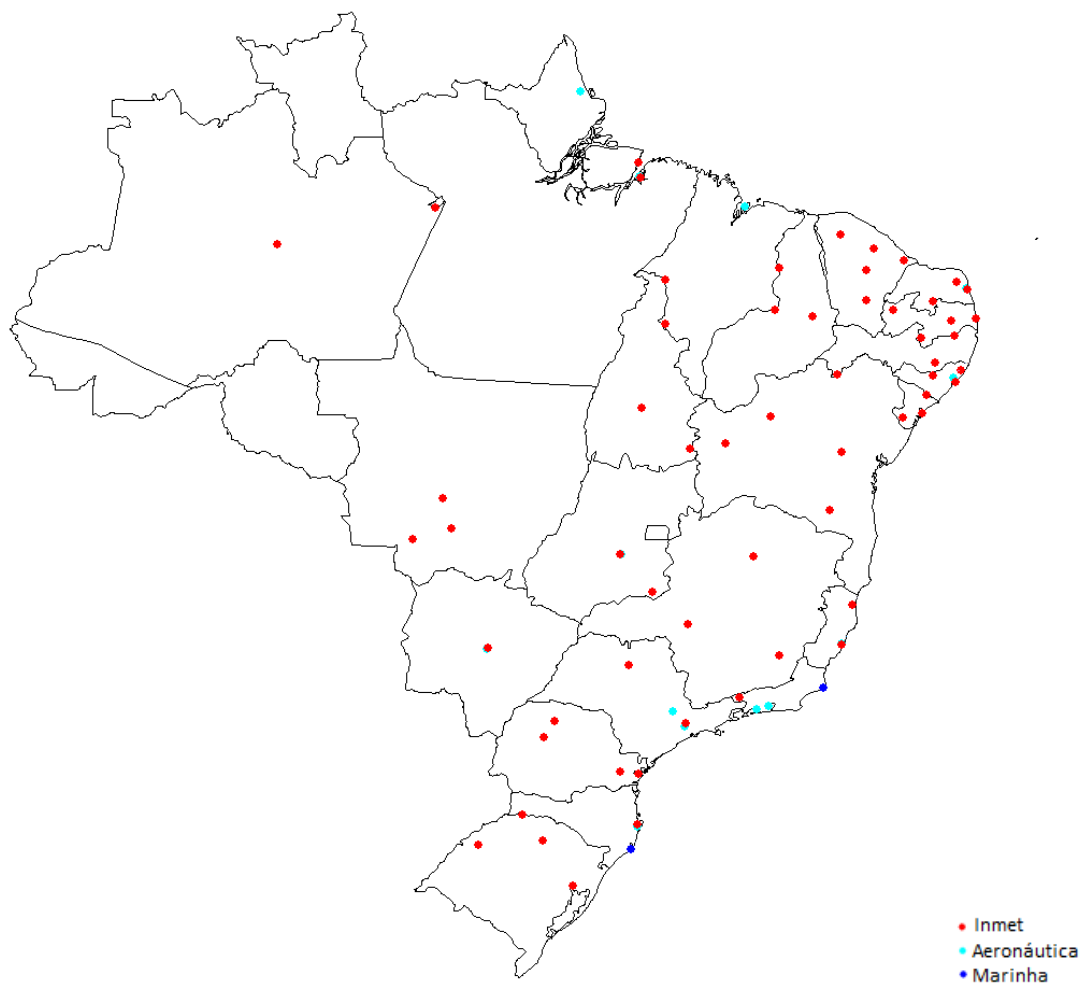
Figura 2: Seleção das estações com notas superior a sete, segundo critério proposto.