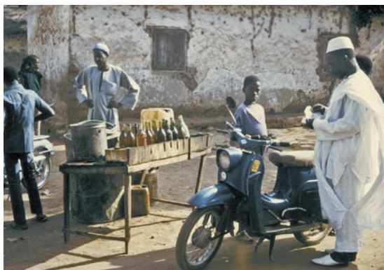
Fig. 5 Venta de gasolina en el interior del país, Guinea.

Ministerio Federal de Transporte, Construcción y Vivienda de Alemania