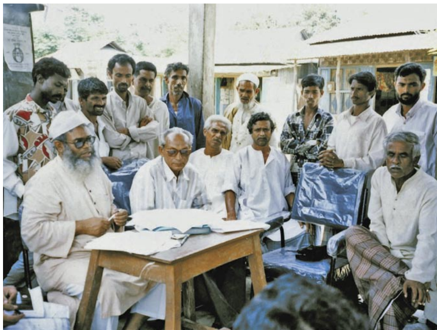
Fig. 1 Un grupo de trabajo discute el financiamiento de caminos rurales, Bangladesh.