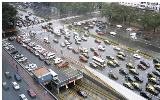
Fig. 7 Los lotes de estacionamientos privados son numerosos en el centro de Buenos Aires. Cobros de alrededor de US$ 2 por hora fueron impuestos en el año 2001.