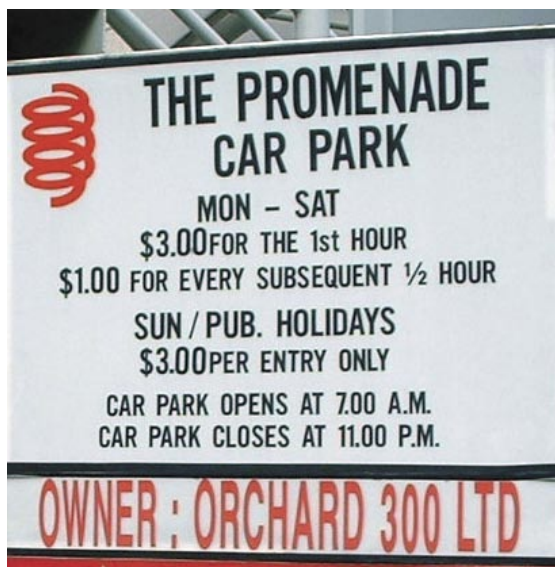
Fig. 10 La tarificación vial electrónica en el sector comercial de Orchard Road está complementada con restricciones de estacionamiento.