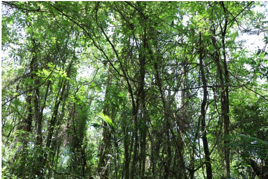
Fotografía: Zona de restauración de la vegetación nativa en la Reserva Nacional Guaricica, Brasil.

El proyecto Bosque Atlántico organizó el "Taller final para promover la cadena de recuperación de la vegetación a escala del paisaje en el Bosque Atlántico: Integración de los proyectos ejecutivos elaborados para cada mosaico", en diciembre. En el evento, participaron 32 agentes y gestores de instituciones públicas y privadas que trabajan en la recuperación de la vegetación nativa de los tres mosaicos de unidad de conservación en que el proyecto actúa: Mosaico Central Fluminense (MCF), en el Estado de Rio de Janeiro; Mosaico de Áreas Protegidas del Extremo Sur de Bahía (MAPES), en el Estado de Bahia; y Mosaico Lagamar, en los Estados de Sao Paulo y de Paraná.