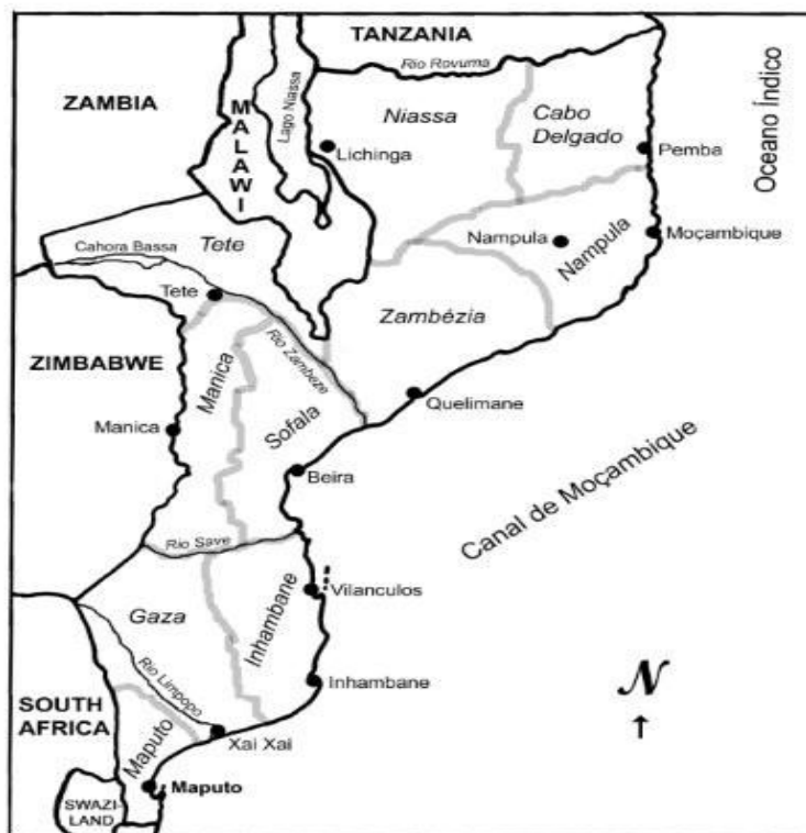
Figura 1. Localização geográfica de Moçambique.