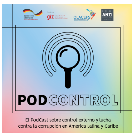
Imagen PodControl.

Fortalecimiento del Control Financiero Externo para la Prevención y Combate Eficaz de la Corrupción. Brasil