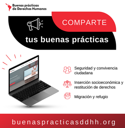
Imagen de la página .

América Latina está llena de desafíos, pero también de proyectos e iniciativas que han encontrado soluciones innovadoras. Por eso, desde nuestra página web , queremos documentar aquellas buenas prácticas que tienen un impacto en las áreas de: seguridad y convivencia ciudadana; migración, refugio e inserción socioeconómica; y restitución de derechos. Leer la nota completa. ¿Quieres compartirnos tu buena práctica? Ingresa aquí.