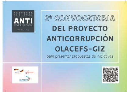
Imagen de la convocatoria.

iniciativas en curso, el Proyecto regional Fortalecimiento del Control Financiero Externo para la Prevención y Combate Eficaz de la Corrupción comenzó la planificación de sus actividades. La misma se desarrollará a partir de enero de 2023 y tiene el objetivo de lograr la participación más activa de las Entidades Fiscalizadoras Superiores (EFS) en los sistemas nacionales de lucha contra la corrupción, incluso en el contexto de la pandemia de COVID-19. Más información. Leer nota completa.