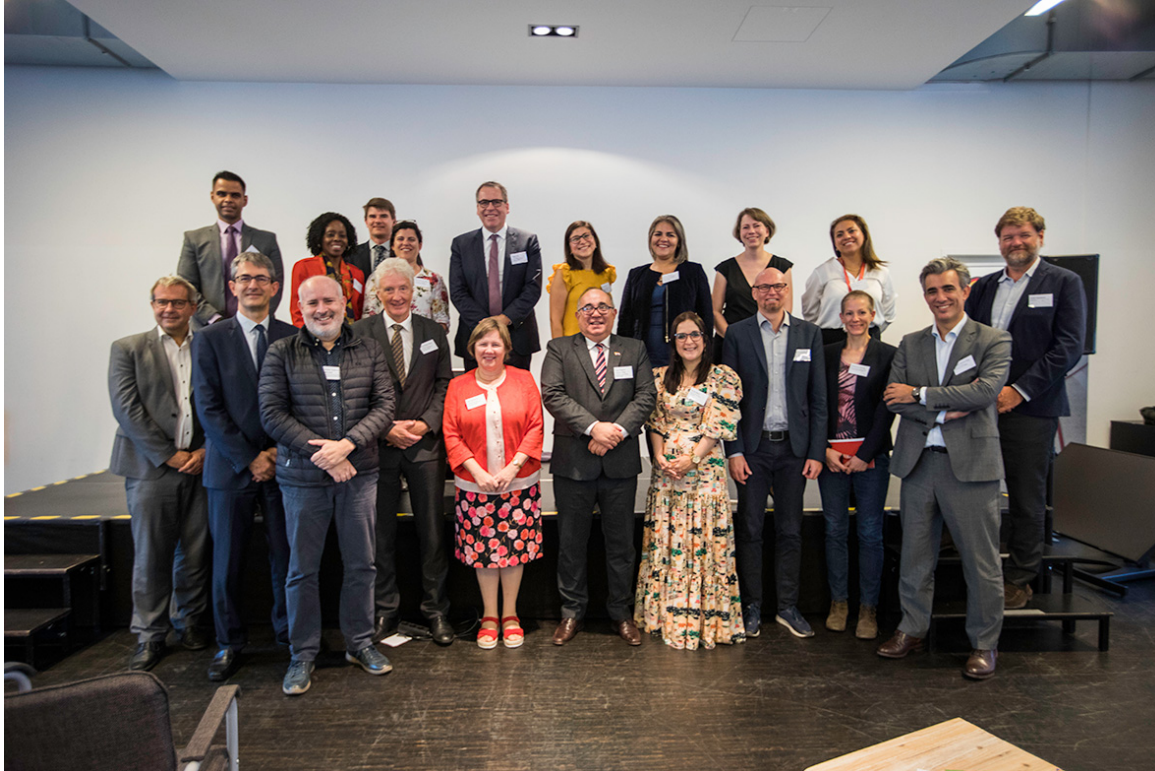
Foto: Participantes de la conferencia.

En el mes de septiembre, el Ministerio Federal de Cooperación Económica y Desarrollo de Alemania (BMZ) acogió la sexta Conferencia Regional sobre Cooperación Triangular, que se celebró en Berlín por primera vez en formato híbrido. El evento, centrado en formas innovadoras de cooperación y alianzas flexibles, reunió a un amplio público internacional. Además de los 45 participantes en Berlín procedentes de distintas regiones - América Latina y el Caribe, Asia, África y Oriente Medio- participaron 170 activamente en línea. Leer nota completa.