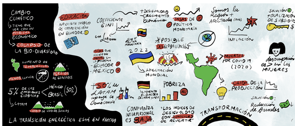
Imagen: Sistematización gráfica Conferencia GADeR-ALC y REDLAC

Red Sectorial de Estado y Democracia en Latinoamérica y el Caribe (REDLAC)