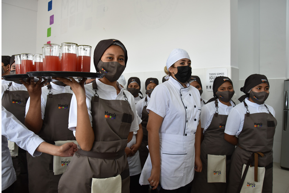
Archivo: Estudiantes de la Escuela Manq'a en Yacuiba. Archivo GIZ Bolivia.

En el mes de junio se realizó la firma del convenio interinstitucional entre la ONG Conexión y la GIZ por el proyecto: “Generando oportunidades socioeconómicas para jóvenes en situación de vulnerabilidad de áreas rurales de los departamentos de La Paz, Tarija y periurbanas en Sucre”. En el marco de este proyecto, la primera escuela de formación técnica en Gastronomía y Alimentación, dirigida a jóvenes, se inauguró en el municipio de Yacuiba al sur del departamento de Tarija. Leer nota completa.