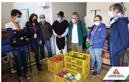
Foto: Visita a proyectos Fondo de Innovación. Archivo Gobierno Provincial de Tungurahua (Página Facebook).

Fondo de Iniciativas Innovadoras. Bolivia