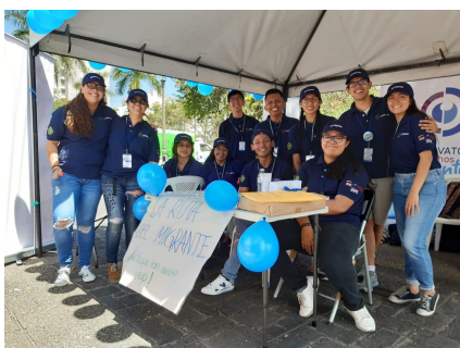
Foto: Jóvenes en campaña de sensibilización.

Promoción del empleo, de la formación y capacitación de jóvenes marginados – CaPAZ; Integración y Reintegración de Niños y Jóvenes en Riesgo de Migración – ALTERNATIVAS.