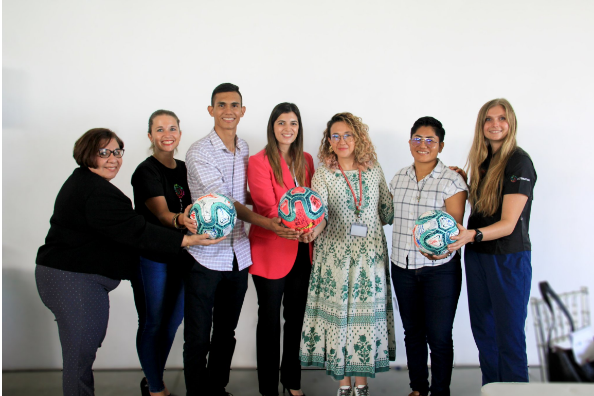
Foto: Deporte con principios.

Promover los valores, el desarrollo de habilidades para la vida y la sana convivencia entre la juventud es el objetivo principal de la metodología Deporte con Principios (DcP), la cual ha sido impulsada por el programa global de la GIZ “Deporte para el Desarrollo”. A partir del pasado mes de agosto, la aplicación de esta innovadora metodología ha iniciado en los países centroamericanos.