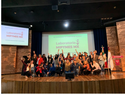
Foto: Evento de inauguración del Laboratorio MIPYMES.