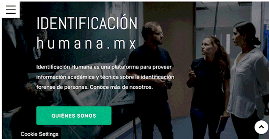
Imagen página web .

Fortalecimiento del Estado de Derecho (FED). México